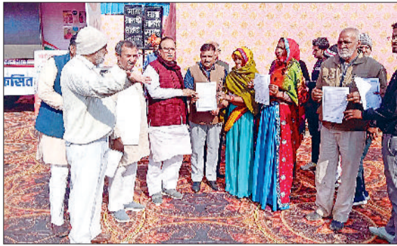
रेवाड़ी। स्टॉल पर योजनाओं की जानकारी लेते लोग व लोगों को प्रचार सामग्री देते हुए व कार्यक्रम पेश करती छात्राएं।

योजनाओं का लाभ पहुंचाने के लिए शुरू की गई है। यात्रा को लेकर समय-समय पर प्रधानमंत्री नरेंद्र मोदी का मार्गदर्शन अद्भुत रहा है और अब तो यह समय आ गया है कि पूरा देश प्रधानमंत्री मोदी की गारंटी में अपना विश्वास जता रहा है। विकसित भारत संकल्प यात्रा घर-घर जाकर