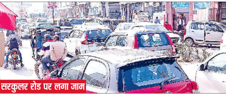
सरकुलर रोड पर लगा जाम

कांटेन्स बेस पर चल रही रोडवेज की भी ऑपरेटर समय पर सर्विस और मॉटिनेस नहीं करा रहे हैं। इन बसों के कारण कई बार हादसे भी हो चुके हैं। बसों का बीच रास्ते में ब्रेकडाउन हो जाना यात्रियों के लिए मुसीबत बन गया है। गत माह में बस स्टैंड से जयपुर के लिए चली एक कांटेन्स बस