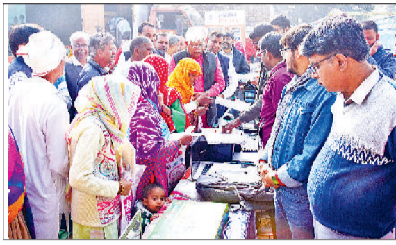
रेवाड़ी। स्टॉल पर योजनाओं की जानकारी लेते लोग व लोगों को प्रचार सामग्री देते हुए व कार्यक्रम पेश करती छात्राएं।