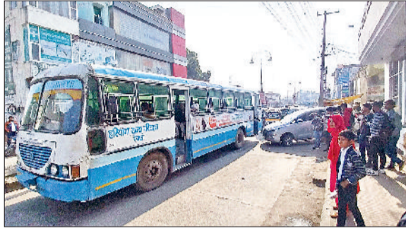
रेवाड़ी। सरकुलर रोड पर खड़ी रोडवेज, बस खराब होने पर चालक से बात करते हुए परिचालक।

शनिवार को बस स्टैंड से सवारियों को लेकर नानुकलां के लिए रवाना हुई हरियाणा रोडवेज आधा किलोमीटर चलने पर ही जवाब दे गई। रोडवेज का सरकुलर रोड पर बीएमजी मॉल के पास अगला पहिया जाम हो गया। ड्राइवर के काफी देर तक मशकत करने के बाद भी बस आगे नहीं चल पाई, जिसके बाद चालक को वर्कशॉप से मिस्त्री बुलाना पड़ा। रोडवेज की काफी बसें कंडम हालत में हैं, जिनको कम दूरी के रूट पर काम में लिया जा रहा है, लेकिन यह बसें इन रूटों पर भी यात्रियों के लिए परेशानी बन रही है। बसों की सर्विस और मॉटिनेस से ज्यादा कमाई पर ज्यादा जोर दिया जा रहा है। पहले भी काफी बार रोडवेज बीच सड़क पर खराब होकर