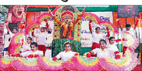
रेवाड़ी। गुप डांस की प्रस्तुति देते हुए टीम।

जिला बाल कल्याण परिषद् की ओर से बाल भवन में आयोजित हुए पांच दिवसीय राज्य स्तरीय बाल महोत्सव में पूरे हरियाणा से जिला और जौनल स्तर पर प्रथम और द्वितीय स्थान पर रहने वाले विद्यार्थियों ने भाग लिया, जिसमें विभिन्न प्रकार की 46 प्रतियोगिताओं का आयोजन हुआ। राज इंटरनेशनल स्कूल के विद्यार्थियों ने 19 प्रतियोगिताओं में अपना उत्कृष्ट प्रदर्शन किया और 6 प्रतियोगिताओं में प्रथम, 2