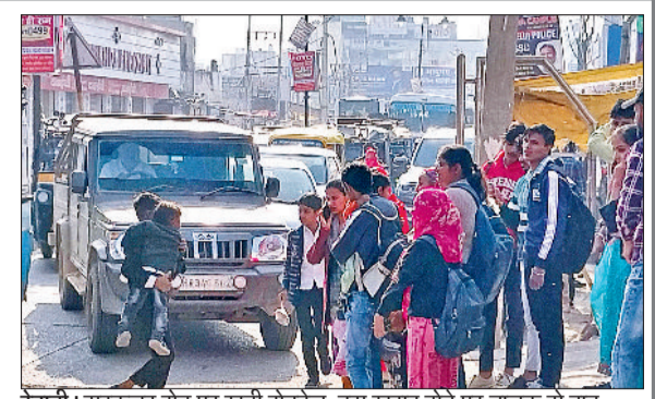
रेवाड़ी। सरकुलर रोड पर खड़ी रोडवेज, बस खराब होने पर चालक से बात करते हुए परिचालक।

करीब एक किलोमीटर का सफर तय करने के बाद ही खराब हो गई। दूसरी बस आने तक लोगों को सड़क पर काफी देर तक इंतजार कराना पड़ा।