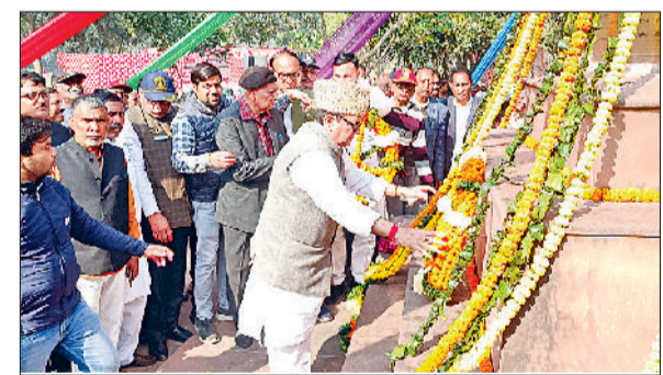
रेवाड़ी। शहीदों को श्रद्धांजलि अर्पित करते हुए मंत्री व अन्य।