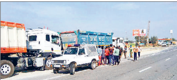
नारनौल। वाहनों के दस्तावेज चेक करती सीएम फ्लाइटिंग एंड आरटीए की टीम।