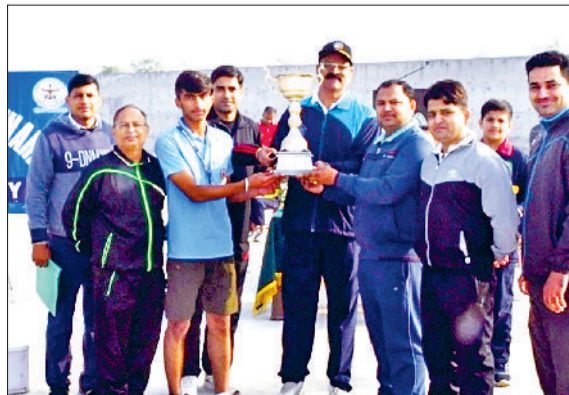
रेवाड़ी। विजेता सदन को ट्रॉफी प्रदान करते प्राचार्य।