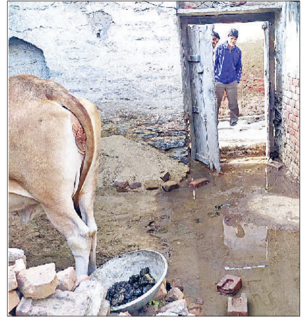
बावल। वार्ड के एक मकान में भरा सीवर का दूषित पानी।